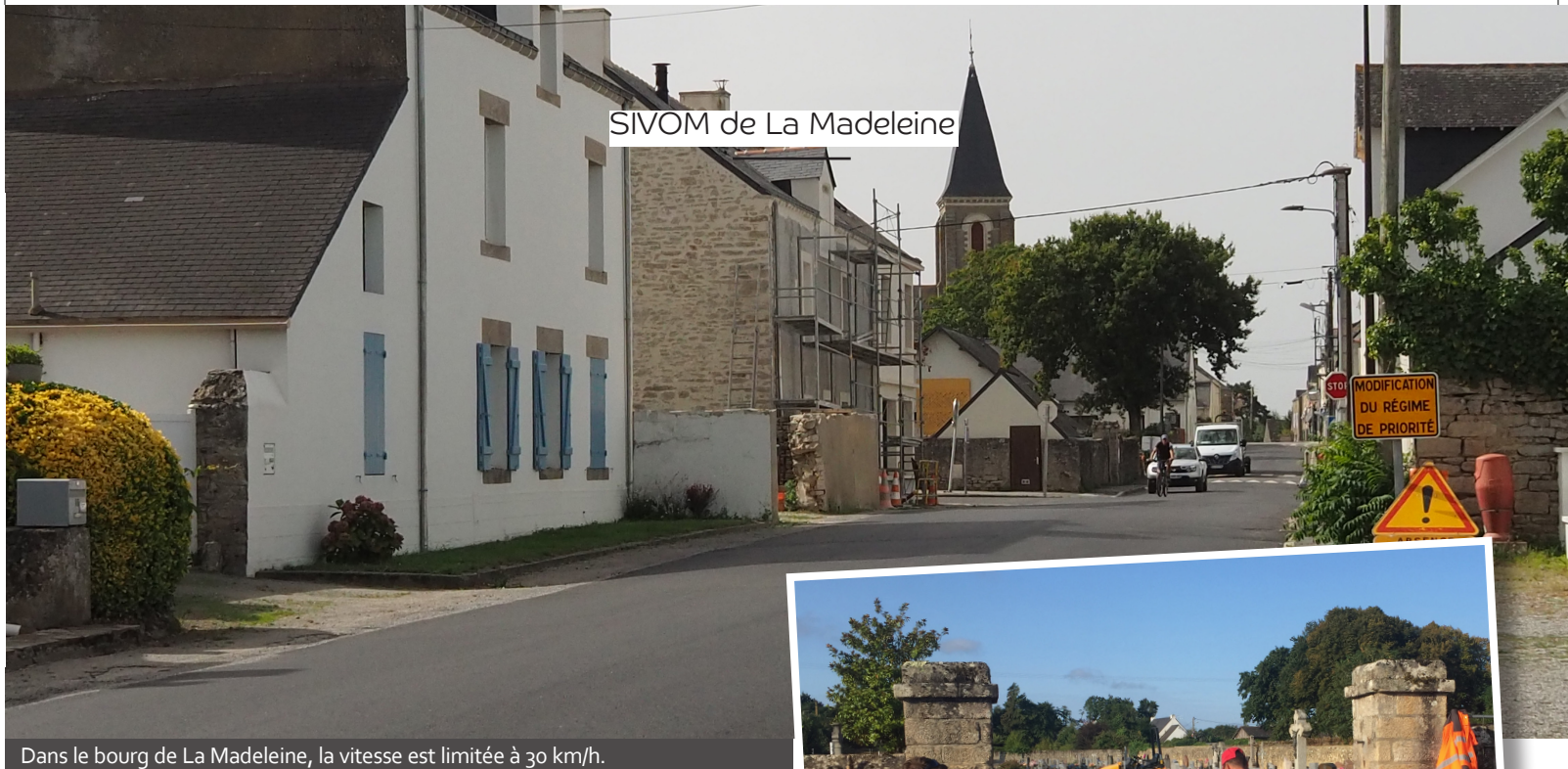
Dans le bourg de La Madeleine, la vitesse est limitée à 30 km/h.