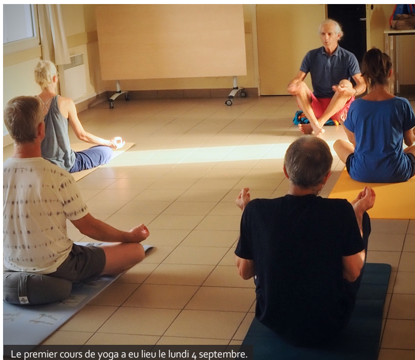
Le premier cours de yoga a eu lieu le lundi 4 septembre.

L'échange entre les membres fait partie intégrante de toutes les activités qui seront proposées par l'association au fil des années. Au delà d'un cours dispensé, les discussions et le partage des connaissances de chacun seront privilégiés.