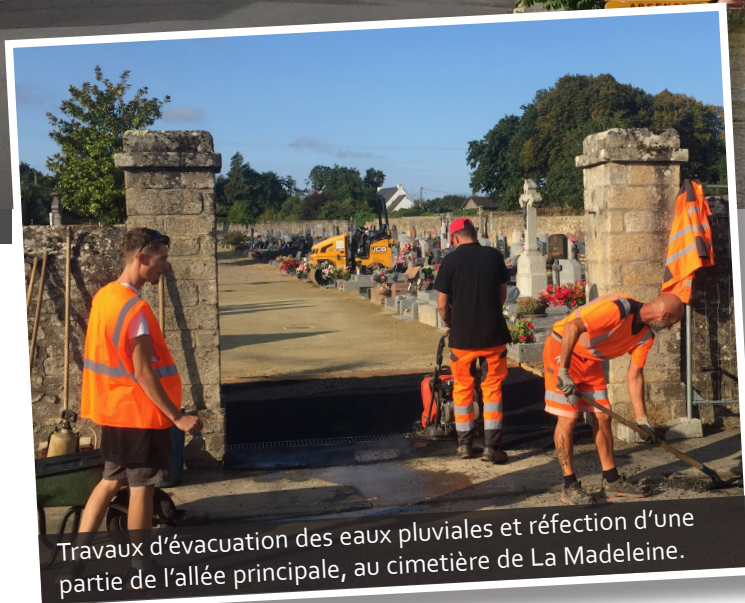
Travaux d'évacuation des eaux pluviales et réfection d'une partie de l'allée principale, au cimetière de La Madeleine.