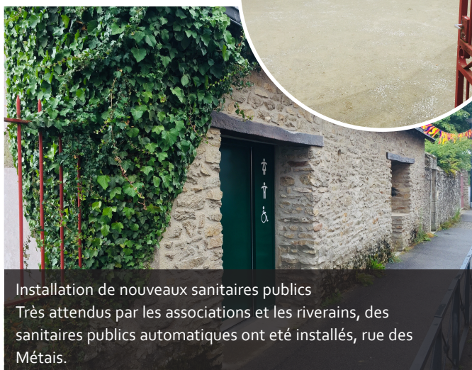
Installation de nouveaux sanitaires publics Très attendus par les associations et les riverains, des sanitaires publics automatiques ont été installés, rue des Métais.