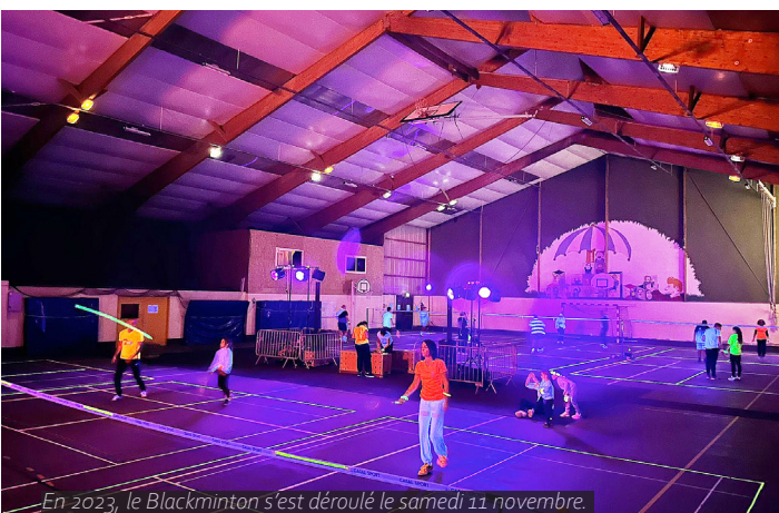
En 2023, le Blackminton s'est déroulé le samedi 11 novembre.