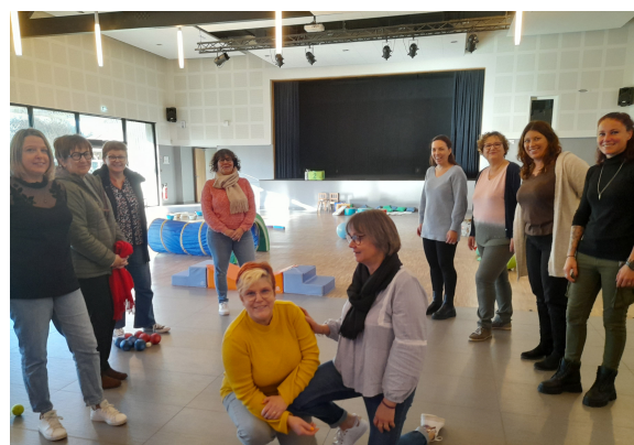
Les élèves de Herbignac et la Chapelle des Marais, les assistantes maternelles organisatrices et les animatrices du RPE.

Contact RPE : 06 86 44 68 81 / rpe@herbignac.com