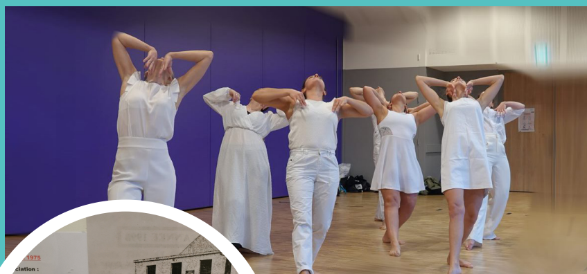
Les danseurs de l'association Premice Danse en répétition pour la pièce « Bach and White ».

Ces associations locales participent activement depuis ces vingt années au dynamisme de notre commune, par la proposition de cours, d'ateliers, de stages, de projections et spectacles de qualité ...et nous les remercions encore. Continuons à soutenir leurs actions !